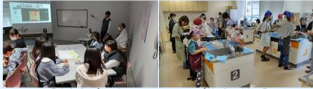
【青年部プレゼンツワークショップ体験の様子】

青年部員がそれぞれの事業に関係のある内容で企画し、講師も自らが務めることでものづくりや仕事の楽しさを伝えました。多くの参加者で思っていた以上に賑やかな事業となり、地域の方に商工会青年部を知っていただける良い機会となりました。